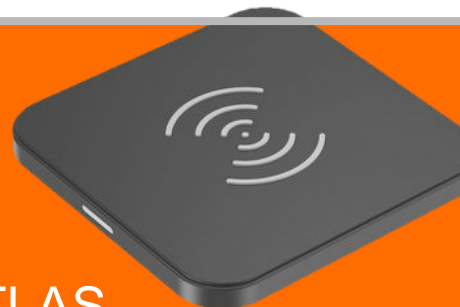
ATLAS QI LAADIJA