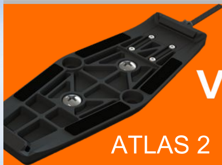
ATLAS 2 HOIDIK

Lisa väliseid andureid ja Vakaros tarvikuid täiuslikuks Atlas 2 kogemuseks.